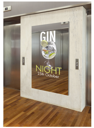
iFace Digital Mirrors™ イメージ

日本カバ株式会社は、【INTEREL】と連携するモバイルデバイスによるルームキーの発行と管理をおこなう、『Saflok Quantum™Series』の展示を予定しております。